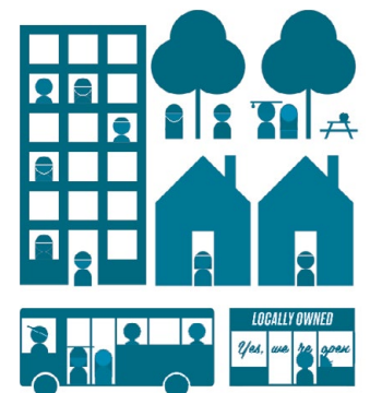
Ilustración: Center for Urban Pedagogy